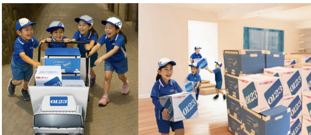
引越マスターイメージパース

このアクティビティを通じて、人生の節目となる引越について「運ぶだけ」でなく、「サービス業」としての可能性を感じてもらえる一助となることを目指します。