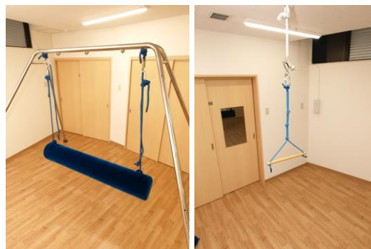
「アートチャイルドケア SED スクール朝霞台」 外観(左)、室内(右)