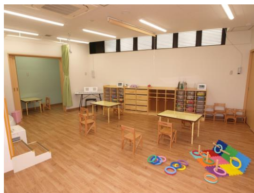
「アートチャイルドケア SED スクール朝霞台」教室

こうした状況を踏まえ、新たにスタートする「アートチャイルドケア SED スクール」では、対象児が将来に亘る社会生活の中で、その子を取り巻く様々な環境に適合しながら、その子の持つ個性を発揮し、周囲から自身が認められる自尊感情を高める事を目指して行きます。併せて、対象児の保護者に対しても不安を取り去り、冷静に今後の育ちを見守る手助けを行います。